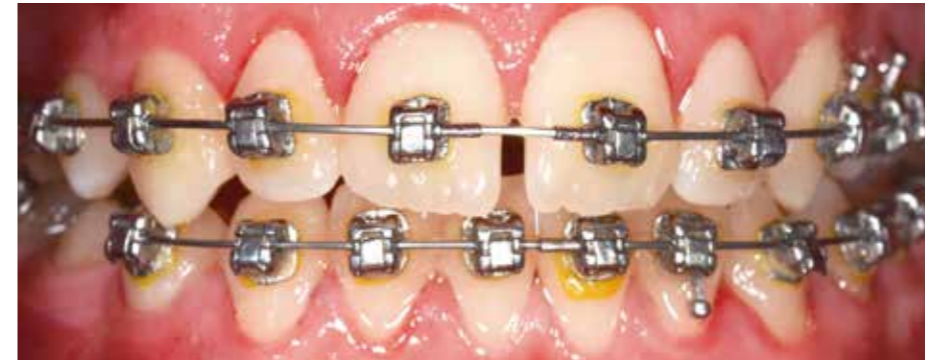
Welche zusätzlichen Herausforderungen stellen sich der KFO – Prophylaxe? Wie wird eine risikoorientierte Prophylaxe-Sitzung durchgeführt? Dies wird im Seminar beantwortet.