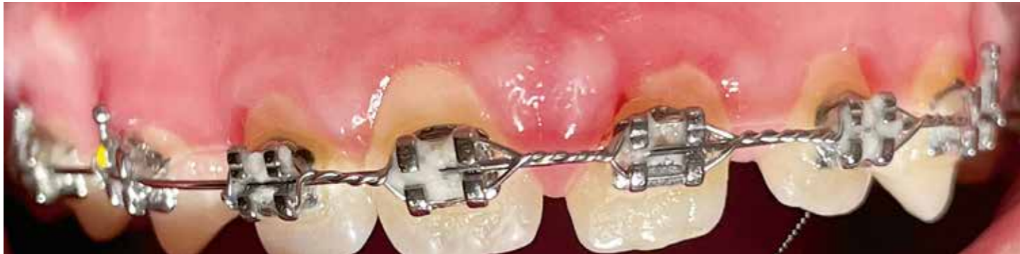
Welche Ursachen kann dieses Erscheinungsbild haben? Ausschliesslich mangelnde Mundhygiene? Antworten dazu und wie vorzugehen ist, erfahren Sie im Seminar.