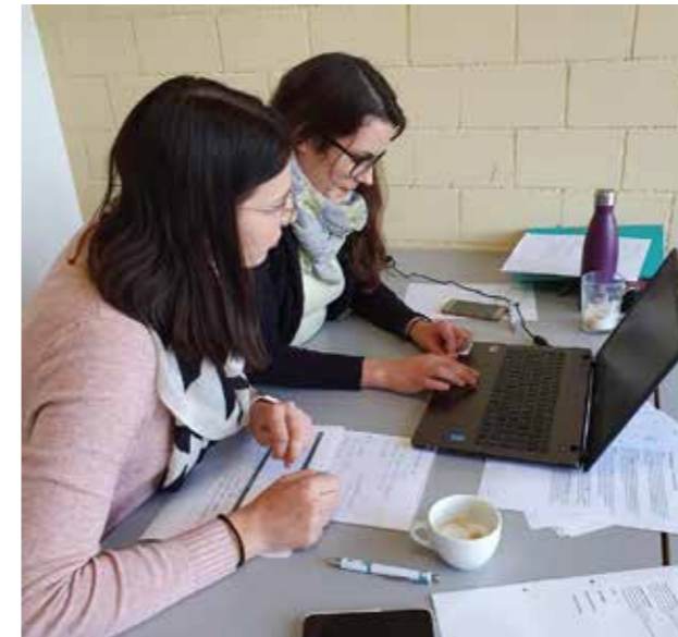
Die Weiterbildung des eigenen Personals ist eine vielversprechende Investition in die Zukunftsperspektiven der eigenen Zahnarztpraxis