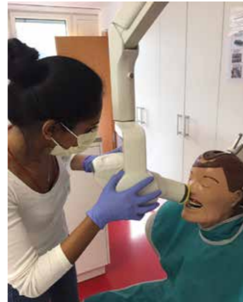
Bestimmte Weiterbildungen wie etwa zum Thema Strahlenschutz werden auch als praxisinterne Veranstaltungen für Chef und Team organisiert.