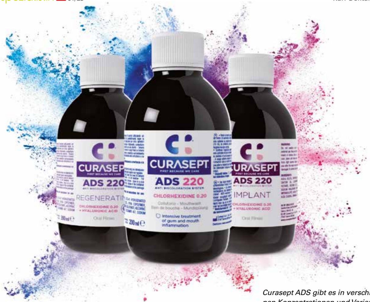
Curasept ADS gibt es in verschiedenen Konzentrationen und Varianten exklusiv bei Karr Dental.