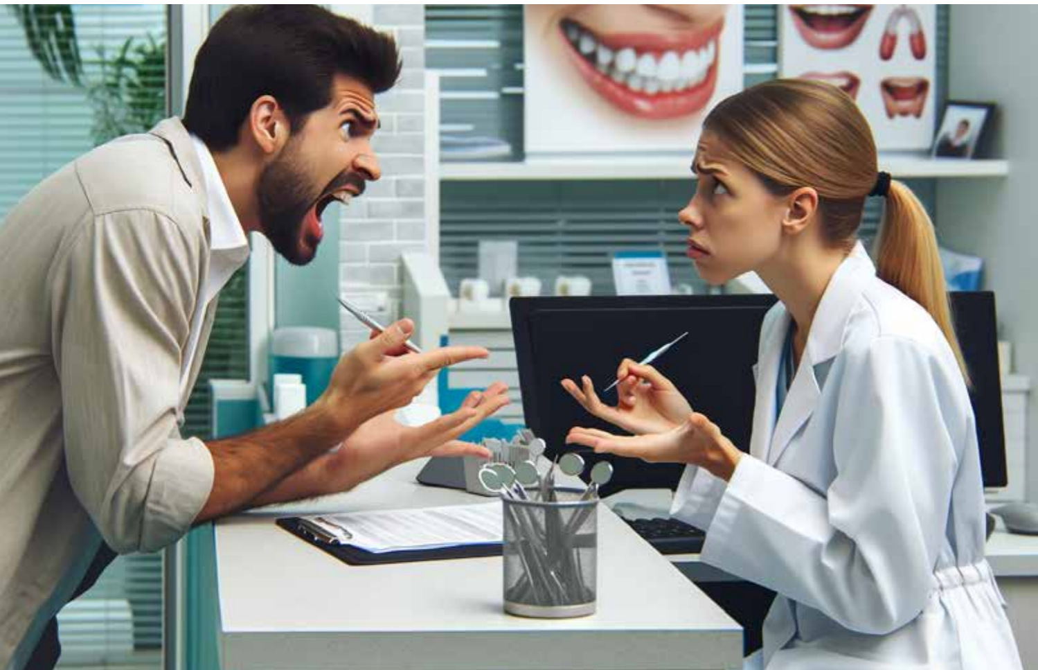
Der korrekte Umgang mit Patientenreklamationen ist entscheidend, um dessen Zufriedenheit wieder zu gewinnen.