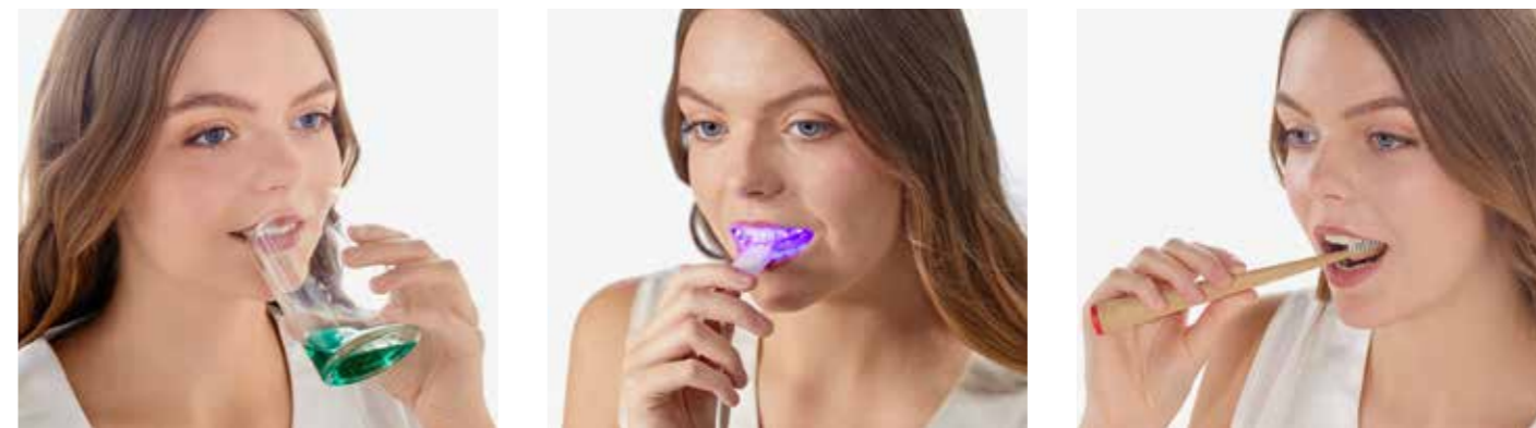
Abb. 3: Einfache Anwendung in 3 Schritten: 1) Mit Lumoralrinse spülen 2) Licht applizieren 3) Wie gewohnt Zähne putzen.

Die 56-jährige Patientin stellte sich mit generalisierter chronischer Gingivitis vor. Mehr als 30 % der Parodontien wiesen entzündliche Veränderungen mit Schwellung, Rötung und Blutung auf bei einem API von 14%, einem SBI von 41% und einem BOP von 56 %. An keiner der 162 Messstellen waren Sondierungsgrade über 4mm messbar. Die Therapieplanung umfasste deshalb ein intensives Mundhygiene-Coaching, die Einleitung von dentalen Hygienephase (Aufklärung,