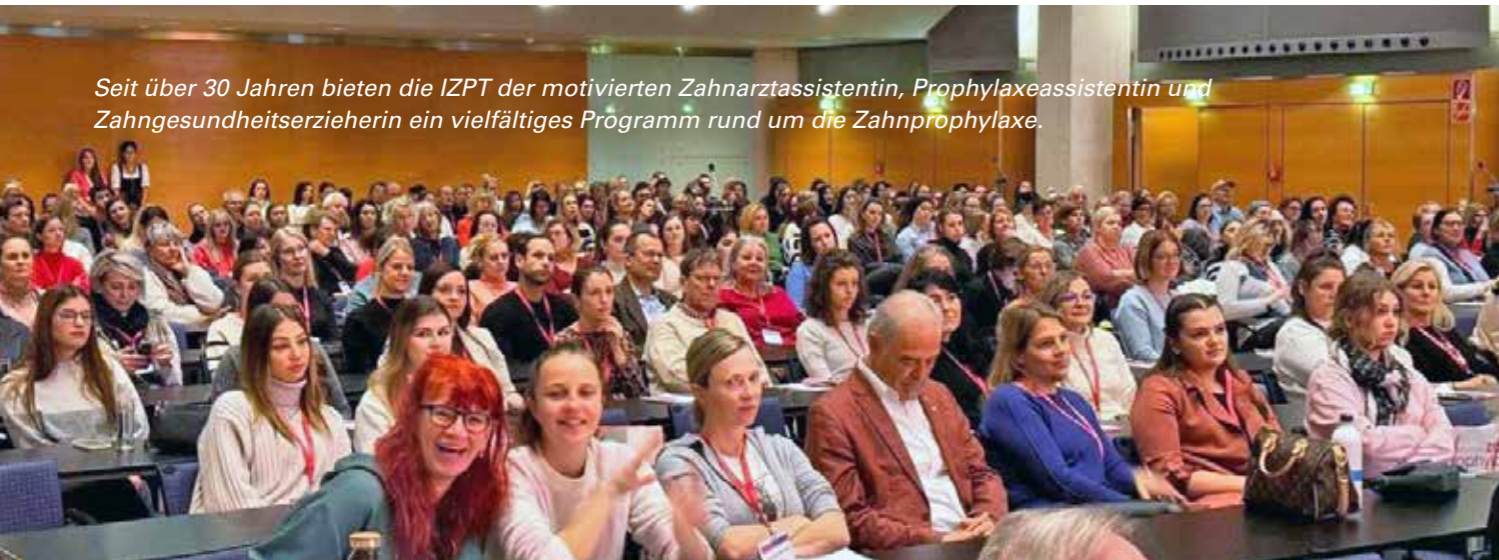
Seit über 30 Jahren bieten die IZPT der motivierten Zahnarztassistentin, Prophylaxeassistentin und Zahngesundheitserzieherin ein vielfältiges Programm rund um die Zahnprophylaxe.