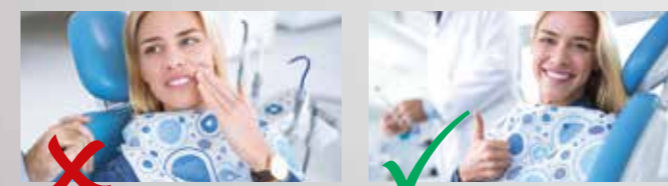
NO PAIN - vorgewärmtes Wasser im Handstück für sensible Patienten

Magnetostriktiver Ultraschall-Scaler für die sanfte Parodontaltherapie