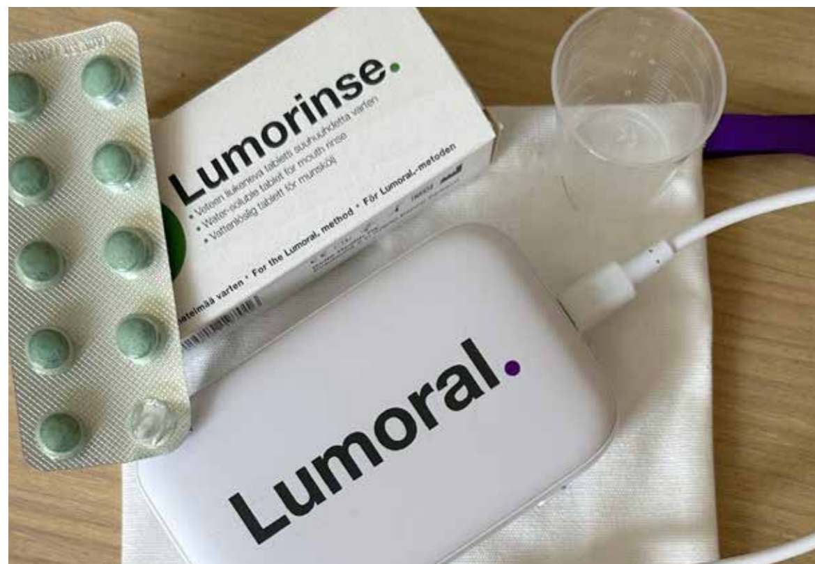
Abb. 1: Um die Mundgesundheit zu erreichen oder zu unterstützen, gibt es ein neues Hilfsmittel, das klinisch erprobt und wissenschaftlich getestet ist.