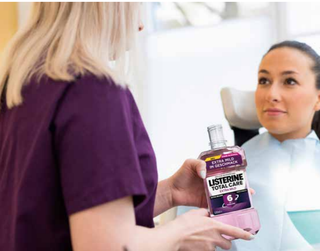
© Kenvue / Johnson &amp; Johnson GmbH