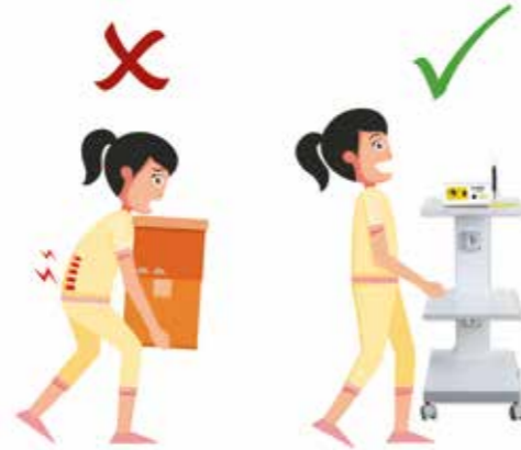
Der praktische Transport mit Integra Cart von Hager & Werken.

Ein lästiges Auf- und Abbauen der jeweiligen Geräte erschwert den Behandlungsablauf und kostet unnötige Zeit. Um zusätzlichen Platz zu schaffen, eignen sich daher besondere Carts, auf welchen Geräte aufgebaut bleiben und direkt zur Behandlungseinheit in Patientennähe geschoben werden können. Die Integra Carts von Hager & Werken verfügen über Trays etwa für Kleingeräte sowie eine integrierte Stromversorgung.